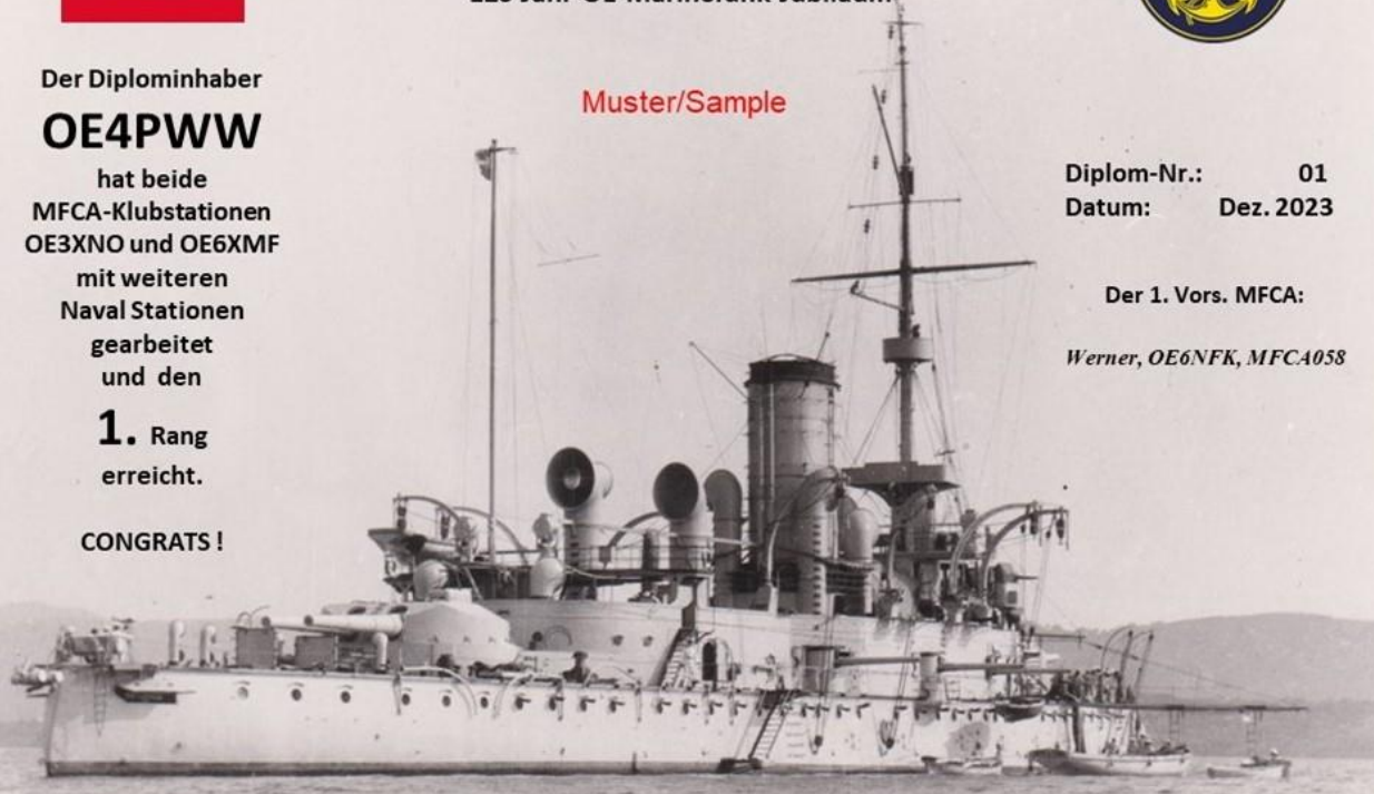
Erinnerung an die erste erfolgreiche Funkerprobung zwischen SMS BUDAPEST und SMS LUSSIN am 21. Dezember 1898 vor Pola