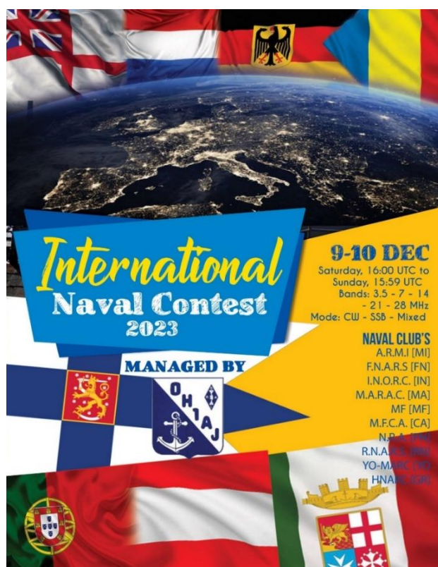
Grafik von IT9MRM/ARMI

Zeit: 9. - 10. Dez. von 1600 bis 1559 UTC