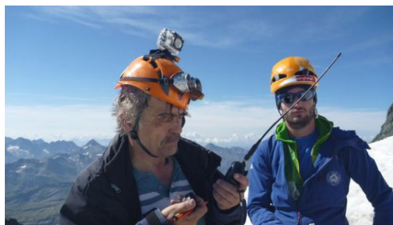
OE1WED on air in FM und sogar in CW (unten)