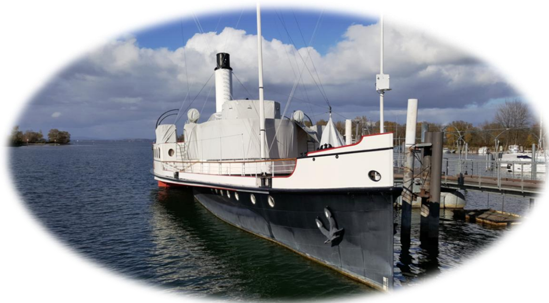
oben: Dampfschiff HOHENTWIEL (1913), unser JHV-Schiff von 2009 und Funkschiff von OM Josef, HB9DAR, CA111 im Hafen von Hard sowie MS AUSTRIA aus dem Jahre 1939 im Hafen von Bregenz

Anfang November war der 1. Vors. OE6NFK für einige Tage am Bodensee und hat dabei auch schöne Bilder vom Winterschlaf der Bodenseeflotte eingefangen.