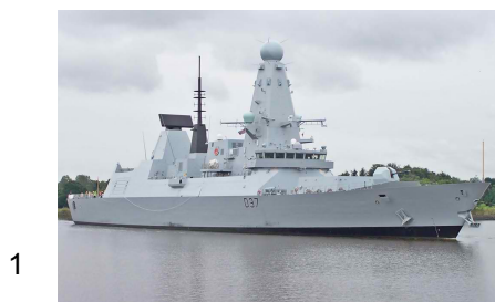
Foto 3: REGELE FERDINAND, Rumänien, siehe: http://ro.wikipedia.org/wiki/Fregata_Regele_Ferdinand

Foto 2: CAVOUR, Italien, siehe: http://de.wikipedia.org/wiki/Cavour_%28550%29